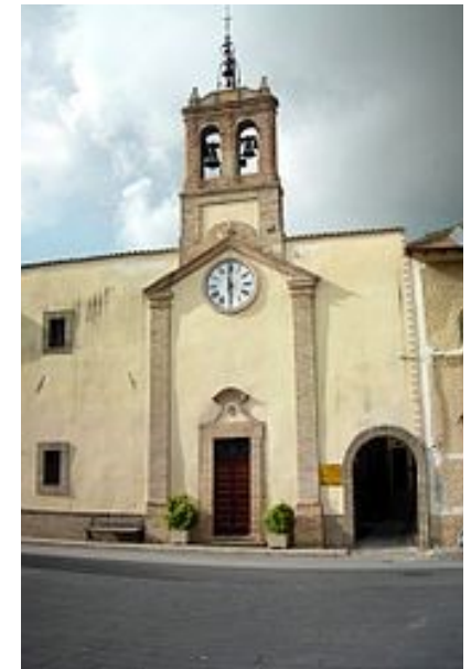
Scuola Primaria E. Giuliani - Costano